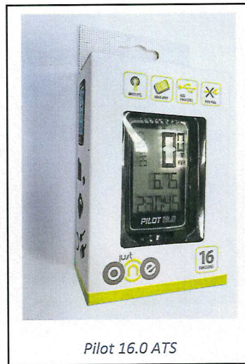
Pilot 16.0 ATS