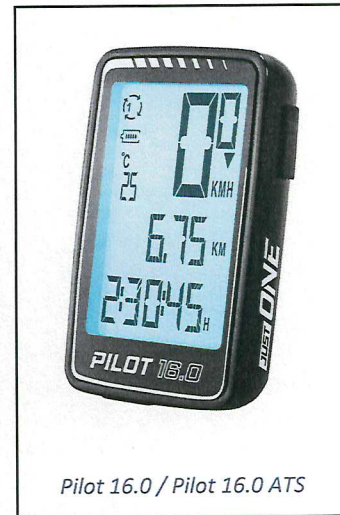
Pilot 16.0 / Pilot 16.0 ATS