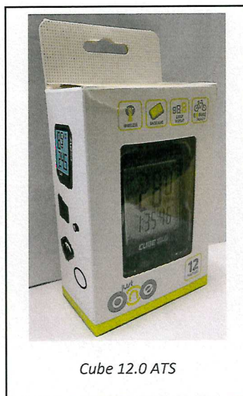
Cube 12.0 ATS